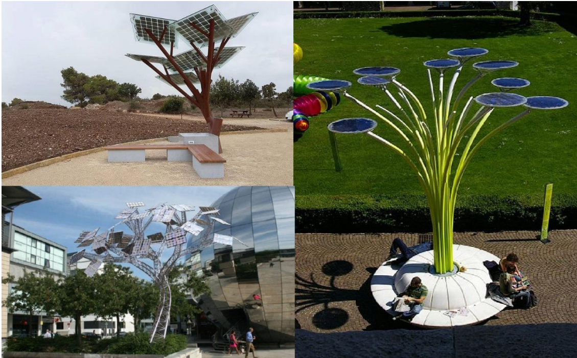
Ejemplo de árboles solares

Esta medida, se debe llevar a cabo de una manera integrada y que haga posible la protección del patrimonio que representa el edificio del ayuntamiento y la plaza. Por ese motivo se podrían utilizar, entre otros elementos, tejas y vidrio fotovoltaico.